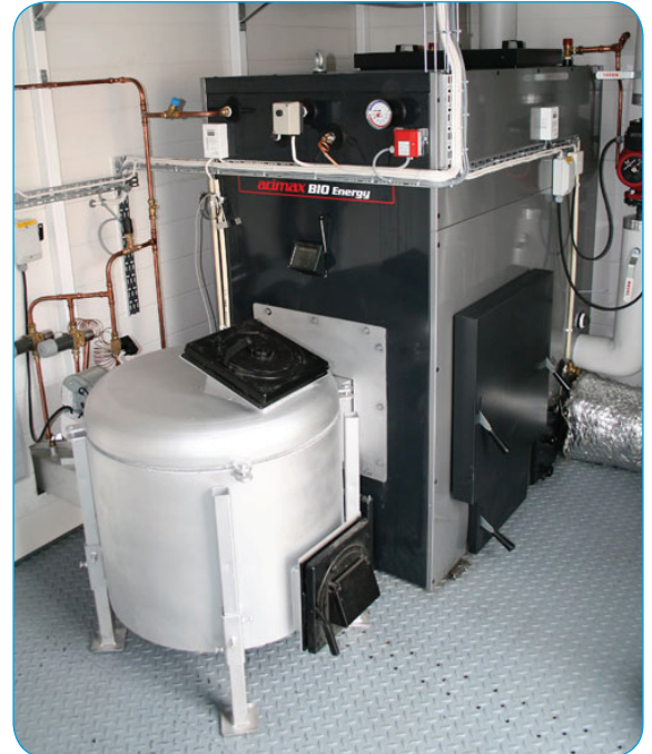
Översiktsbild på energibrännare samt biopanna.