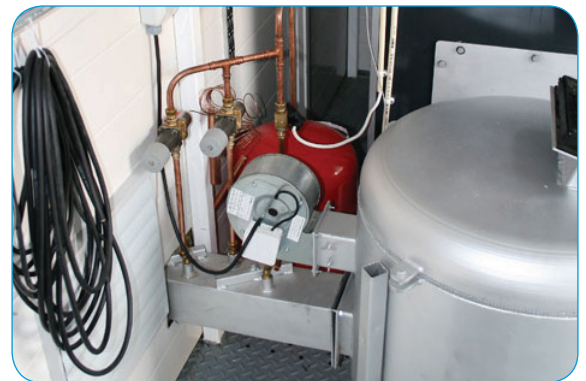
Röret med matarskruven.